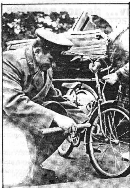
Youri Gagarine essayant vainement de regonfler le moral des soviets