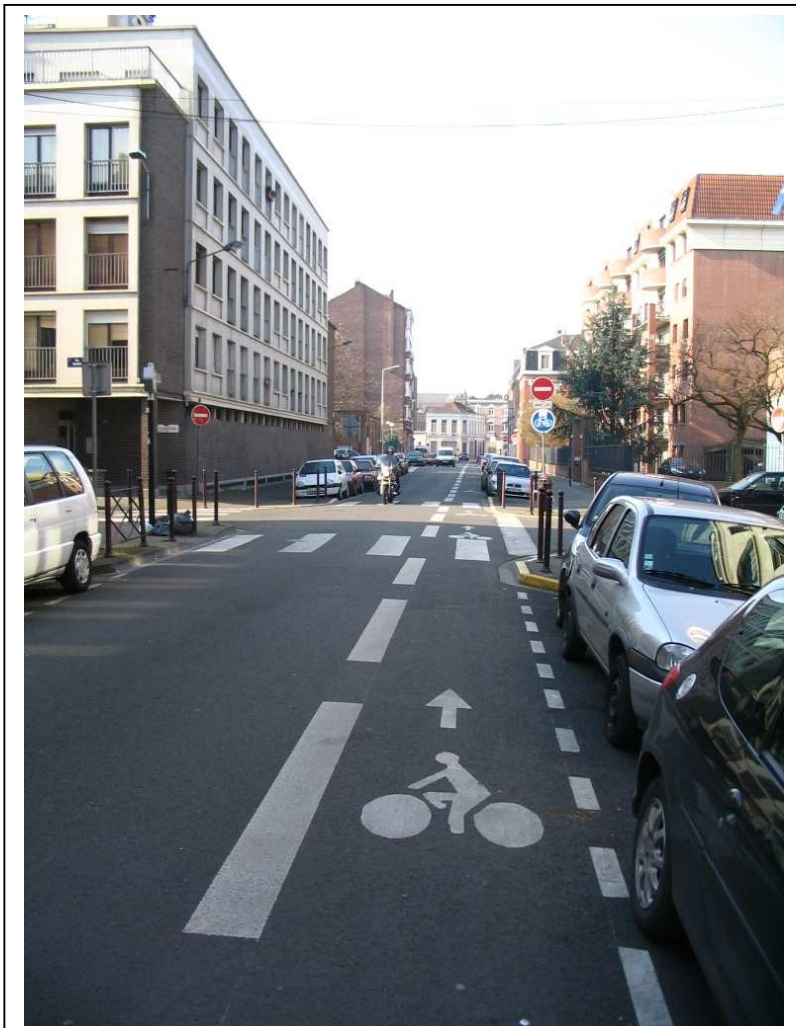
Sens de circulation des cyclistes