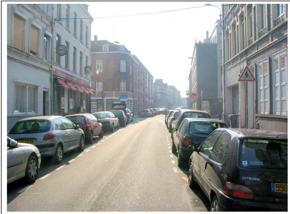
Sens de circulation des automobilistes

↳ 3 accidents se sont déroulés au niveau du même carrefour : rue des stations / rue meurein.